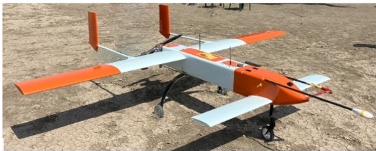
小型固定翼ドローン (Phoenix LR)

TG : Tendaho Graben, D-MH: Dubbahu-Manda Hararo Rift 航空磁場探査での飛行航跡：2019年（白線），2023年（青線）