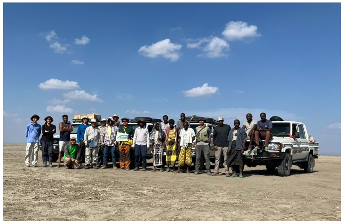
調査関係者集合写真